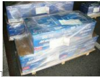
標準パレット(1)標準パレット(2)